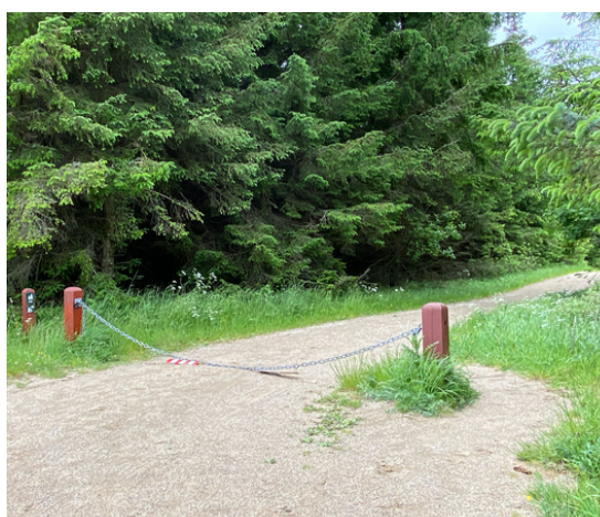
Eksempel på billede af potentiel barrierer og smalleste passage på ruten (stien højre om pælen).