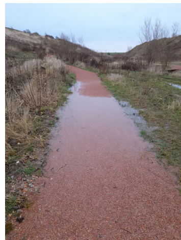
Eksempel på billede af særligt opmærksomhedspunkt, her vand på sti om efteråret.