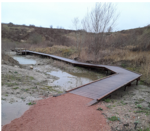
Eksempel på billede af overgangen mellem forskellige belægninger på ruten.