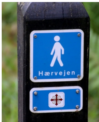
Eksempel på afmærkning af ruten.