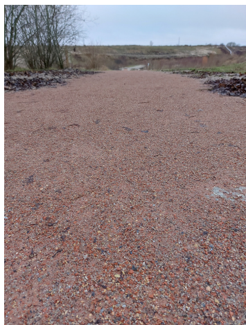
Eksempel på billede af rutens dominerende belægning.