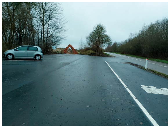
Eksempel på billede af området som helhed og parkeringspladsens overflade.