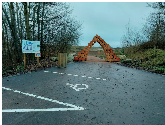
Eksempel på billede af særskilt handicapparkering og vejen fra parkeringspladsen til rutens start.